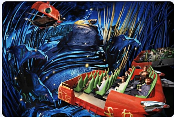
Défi Arthur l'aventure 4D